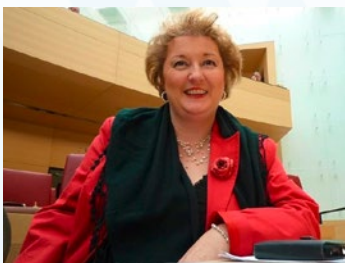
Für klare Botschaften im Plenarsaal.