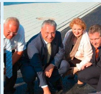
Flüsterasphalt für Stein.