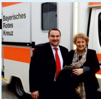
Immer nah am Menschen.