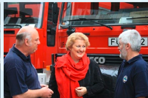
Ohne ehrenamtliches Engagement wäre unsere Gesellschaft um vieles ärmer.