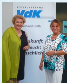
Mitmenschlichkeit ist das Band, das die Gesellschaft zusammenhält.