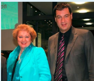
Gute Kontakte zum Finanzminister.

„Ohne soziales Miteinander gibt es keine gesellschaftliche Weiterentwicklung.“