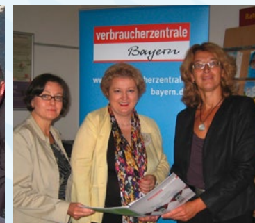
Verbraucherschutz - heute wichtiger denn je.